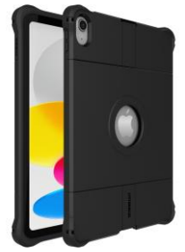
Black 77-89980 (ProPack) 840262399937

Aumenta le funzionalità del tuo iPad con il sistema per custodia OtterBox uniVERSE. uniVERSE è dotato di due guide e un supporto centrale, che ti consentono di fissare in modo sicuro e sostituire facilmente i potenti accessori del partner senza rimuovere la custodia. La custodia per tablet offre un altro punto di attacco al centro per le soluzioni di montaggio.