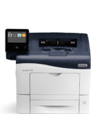
Stampante a colori Xerox® VersaLink® C400