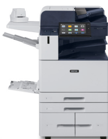
Stampante multifunzione a colori Xerox® AltaLink® C8130/ C8135/C8145/ C8155/C8170