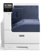
Stampante a colori Xerox® VersaLink® C7000