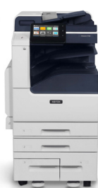
Stampante multifunzione a colori Xerox® VersaLink® C7120/ C7125/C7130