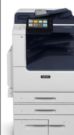
Stampante multifunzione Xerox® VersaLink® B7125/B7130/ B7135