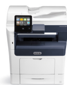
Stampante multifunzione Xerox® VersaLink® B405