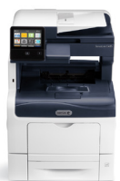
Stampante multifunzione a colori Xerox® VersaLink® C405