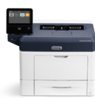
Stampante Xerox® VersaLink® B400