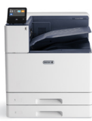
Stampante a colori Xerox® VersaLink® C8000