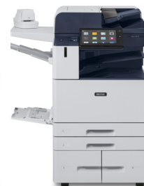
Stampante multifunzione Xerox® AltaLink® B8145/B8155/ B8170

Per ulteriori informazioni sulla tecnologia Xerox® ConnectKey, visitate il sito www.connectkey.it .